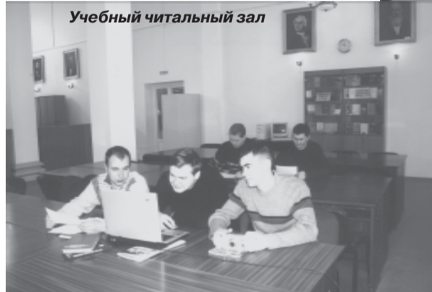
Учебный читальный зал