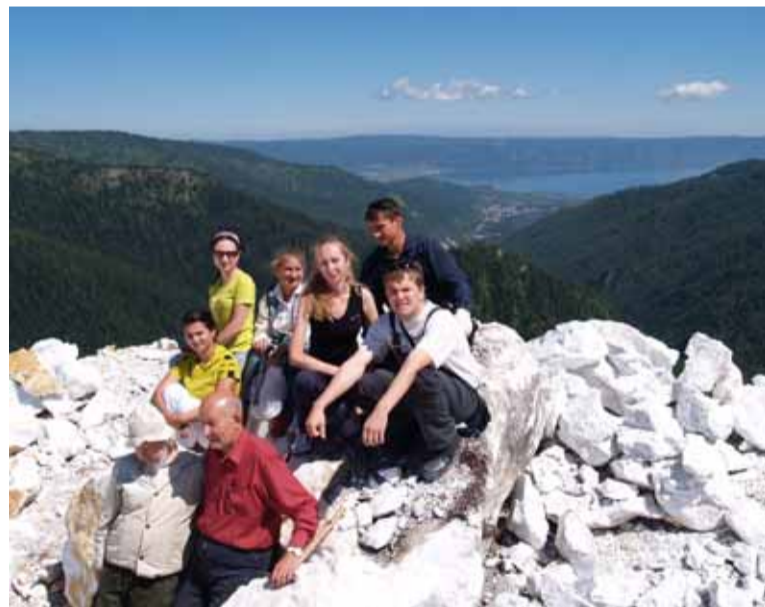
Месторождение мрамора «Перевал». Слюдянка