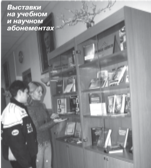
Выставки на учебном и научном абонементе

Что вы получите, обратившись в библиотеку?