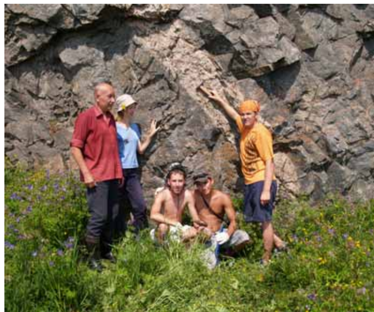
Пегматитовая жила. Маритуты